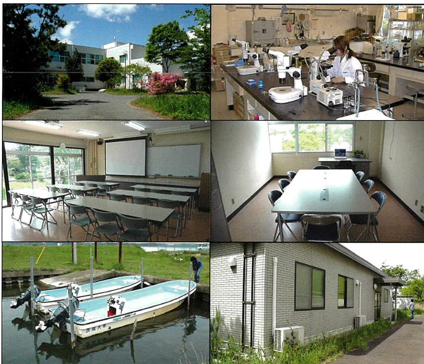
本館(左上)、講義室(左中)、調査船(左下)、実験室(右上)、会議室&訪問教員室(右中)、宿泊棟(右下)